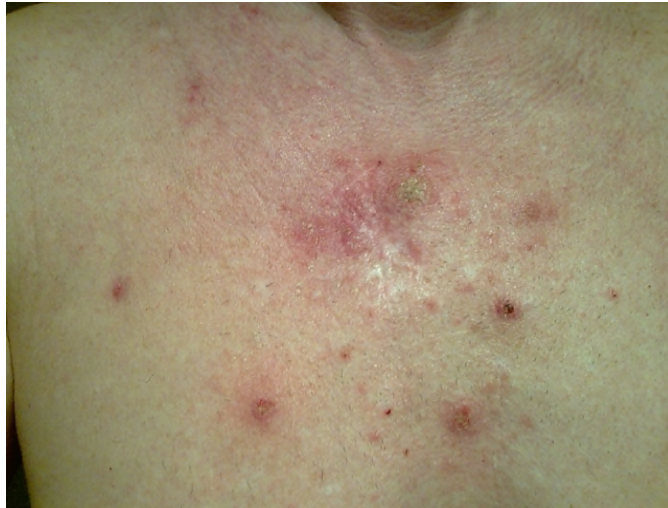
Strahleninduziertes basales Plattenepithel-Karzinom der Haut – ©2012-05-10

Das Plattenepithelkarzinom in der rezidivierenden Form wird auch Morbus Bowen genannt.