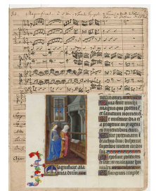
Deposuit potentes (Magnificat)

Kyrill, Freund und hl. Patriarch, scheint Ihnen die Gunst Gottes versprochen zu haben: