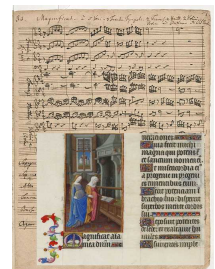
Депозит потентес (Магнификат)

Кирилл, друг и святой Патриарх, обещал тебе, кажется, благоволение Божие: Вы идете по пути исторических героев. Да – так считают многие простые умы.