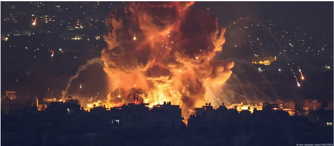
Israelischer Luftangriff in Beirut

Attacke der Streitkräfte Israels im Gaza-Streifen und Westjordanland. Ziel: Okkupation, „freiwilliger Auszug“ von verbliebenen ~2 Millionen Arabischer Semiten in angrenzende Staaten. Ziel: Riviera des Nahen Ostens . Pessach 2025