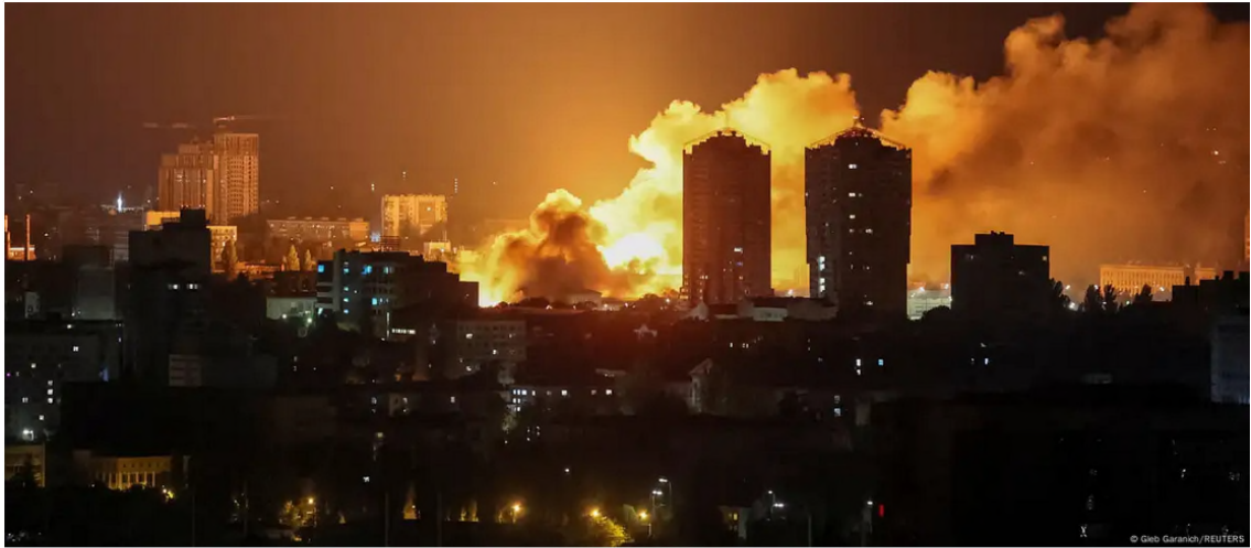
Brände in Kyjiv in Folge der russischen Attacke