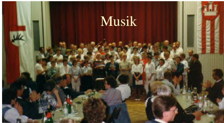
Partnerstädte - Partner-Chöre: Klosterneuburg und Göppingen 1986

Kult, Berührung mit dem Kosmos, Tönen, Körperlichkeit Lachen-Weinen, Spielen, Therapie, Geselligkeit, Chor- und Hausmusik Konkurrenz – Kooperation , Dissonanz – Harmonie , Krieg – Glück