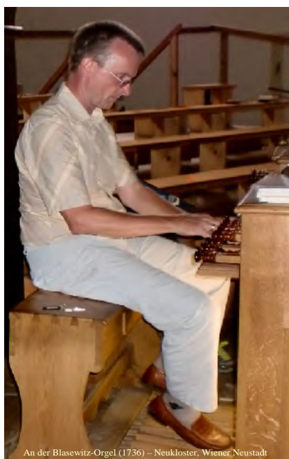
An der Blasewitz-Orgel (1736) – Neukloster, Wiener Neustadt

An der Blasewitz-Orgel (1736) im Neukloster zu Wiener Neustadt