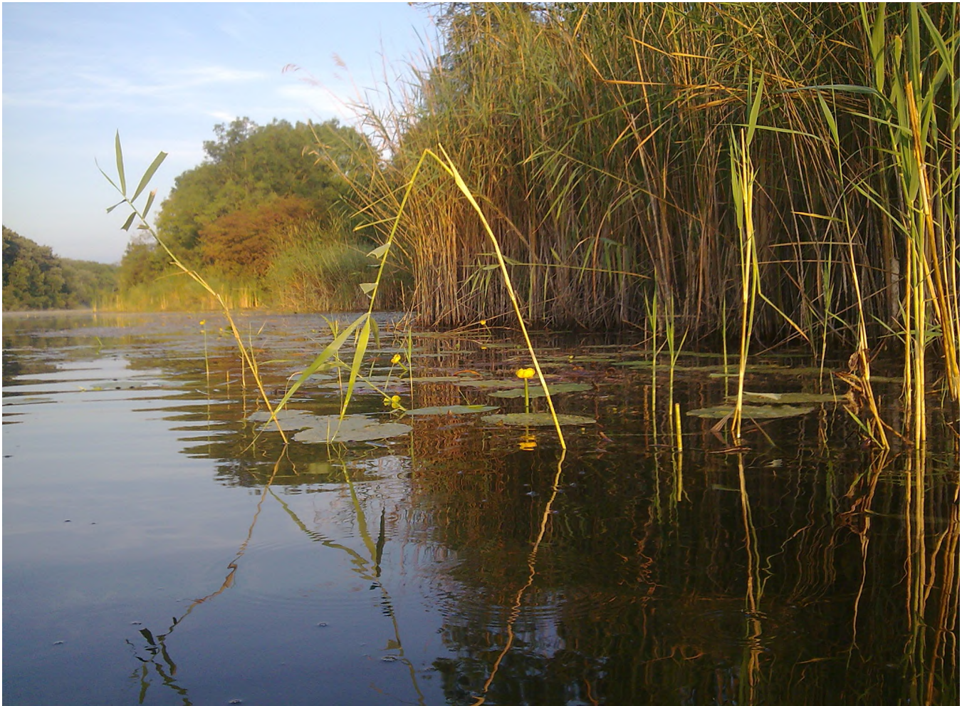
Esslinger Lobau – September 2024