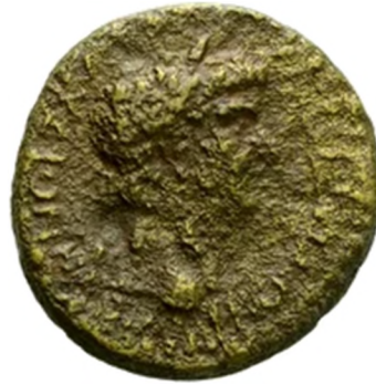
Denarius des Kaisers Tiberius Claudius Caesar Augustus „Germanicus“ 10 v. Chr. – 54 n. Chr.

Wer das nun schmählt Sept, Nov. verrät, Der dahin geht – Wo FAKE NEWS! steht.