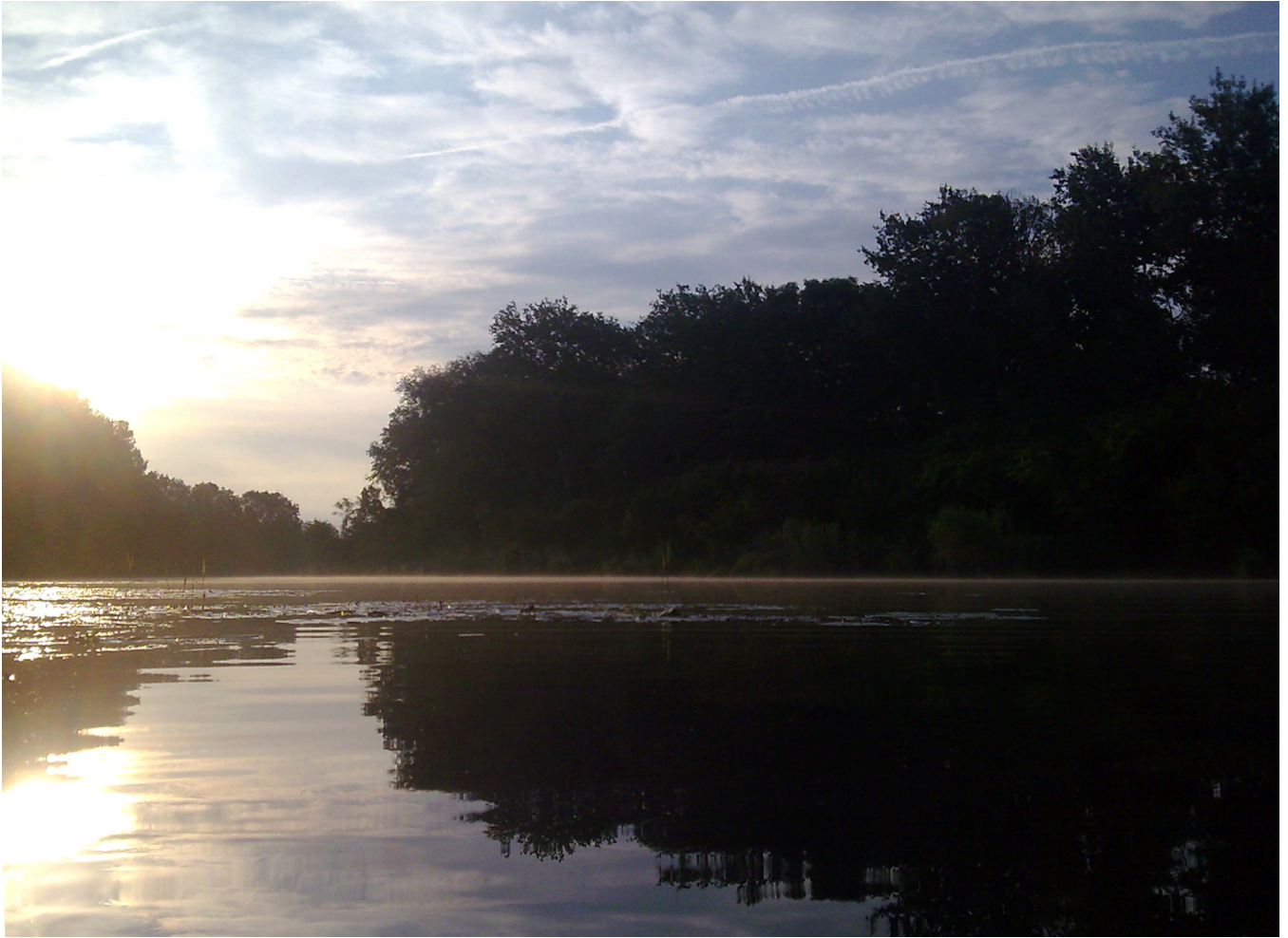
Esslinger Lobau – September 2024