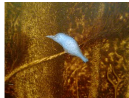
Arik Brauer, Detail aus Natur

Sinn Gefühl Feinsinn Galgenhumor Feinfühler gestuft Scharfsinnig getönt