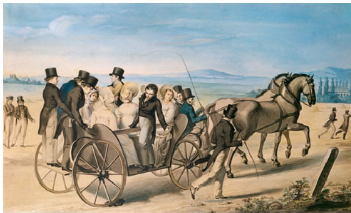
Leopold Kupelwieser (1796 – 1862) Schuberts Landpartie

Wenn wir den Biographien glauben dürfen, stellt sich Schubert als eine Persönlichkeit dar, der es an Lebenslust nicht mangelte. So sind seine Ausflüge mit Freunden im „Stellwagen“ (einem Pferdegespann) in die nahe und weite Umgebung Wiens sprichwörtlich: Hier wurde sich unterhalten, gewiss waren auch Schülerinnen und andere junge Damen dabei. Es wurde auch musiziert und wurden kleine Lieder für die gerade vorhandene Besetzung komponiert und gleich probiert.