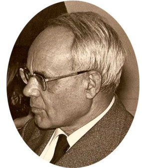
K. Rahner: Lebenslauf (1977)

➔ Zu Karl Rahners Text: Vom Lachen und Weinen des Christen (1951)