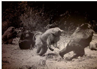
Pavian verfolgt Schimpansen vor Publikum: Lawick-Goodall 1970

Seit 1989 bietet der Autor individuelle Beratung und Betreuung von sozialen Gruppen (z.B. Lehrenden, Schülern, Eltern) in Form von Seminaren, Vorträgen und Fallarbeit an. – Bestehende strategische Vorhaben können supervidiert werden. Für Experten (m/w/i) gibt es die Option einer Lehrsupervision.