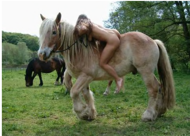
Eros und Macht / Eros der Macht: Partnerschaft oder Surrogat?

mit Musikvorschlägen für eine Sendereihe – Hörfunk