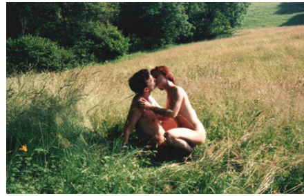
© 1990 by Dr V. Ellmauthaler. – Link: Nackt (gratis)