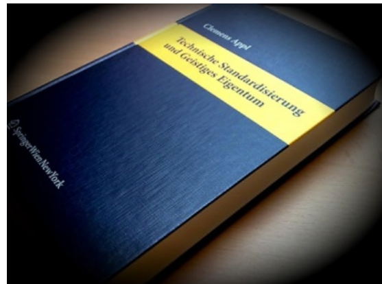
Beispiel für ein fertiges Buch – siehe auch unter Rezensionen

edition | http://medpsych.at/edl.html E-Mail: edl@medpsych.at Fon: 0043 699 10 900 802